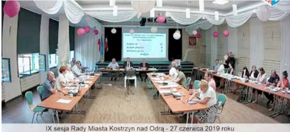
IX sesja Rady Miasta Kostrzyn nad Odrą - 27 czerwca 2019 roku